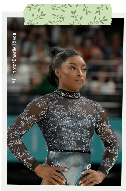
Simone Biles (turnar) .....