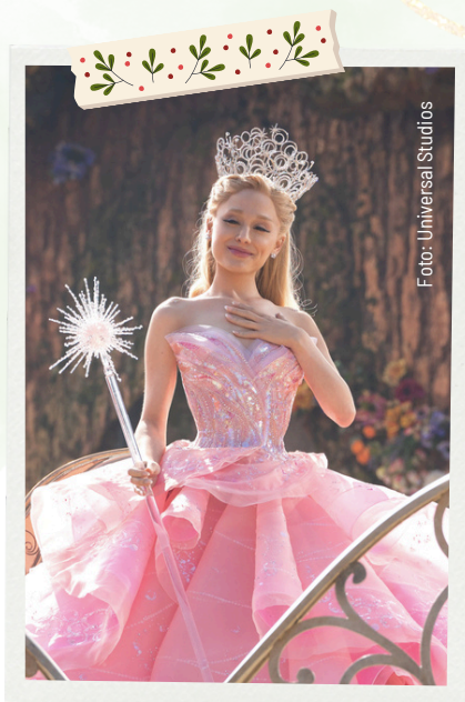
Ariana Grande (som Glinda) .....