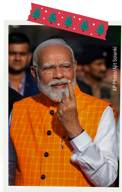
Narendra Modi (statsminister i India) .....