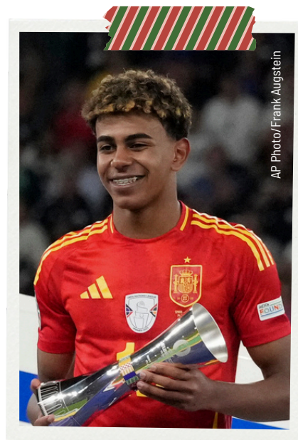
Lamine Yamal (fotballspelar) .....